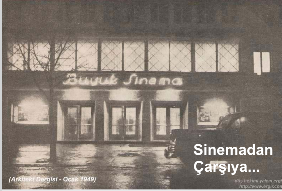
(Arkitekt Dergisi - Ocak 1949)

düş hekim i yalçın ergir http://www.ergir.com