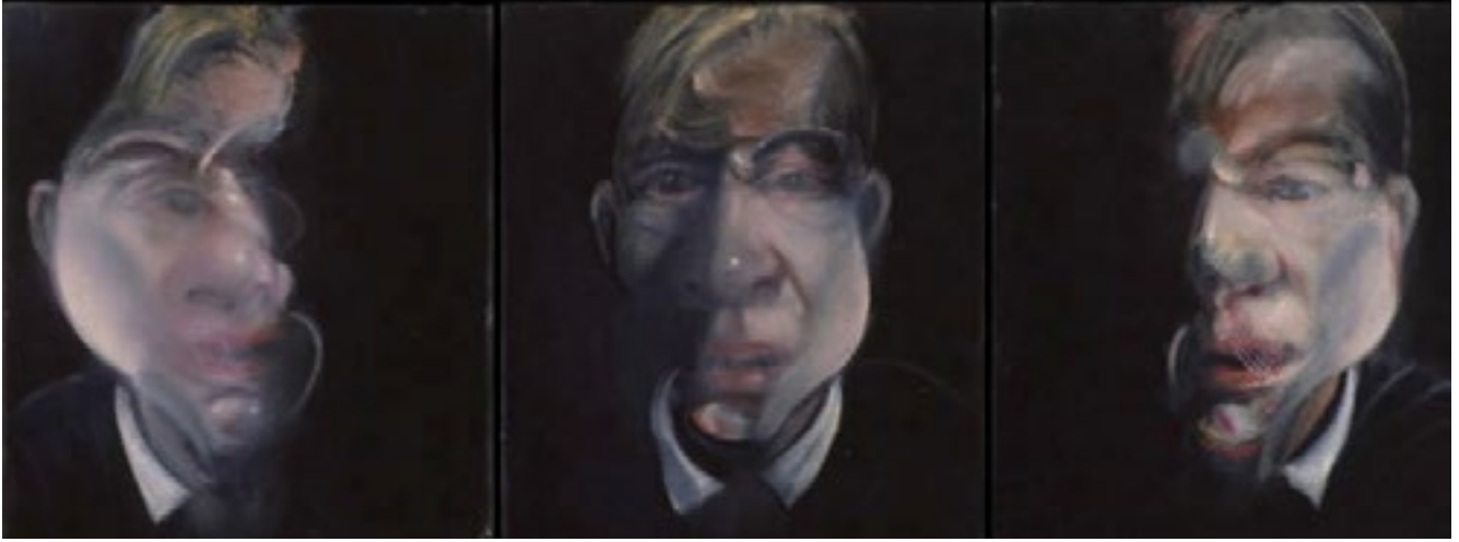
Resim 1. Francis Bacon, Three studies for a self-portrait , 1979–80, The Metropolitan Museum of Art, New York, Jacques and Natasha Gelman Collection, 1998 http://www.francis-bacon.com/blog/press-release-francis-bacon-five-decades/#sthash.mevEdd6P.dpuf

Kavramanı istediğim: Aşağılara doğru atomlar