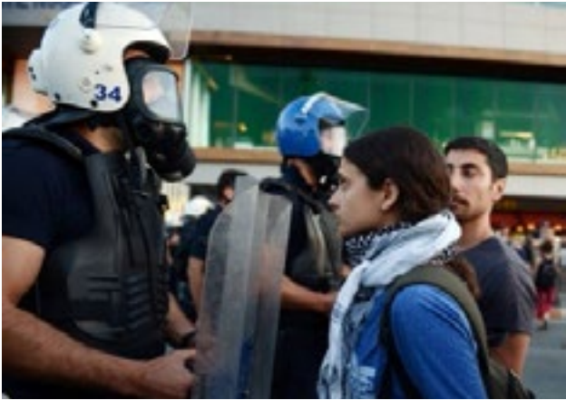
Kırmızıyı Çoklayan An'lar