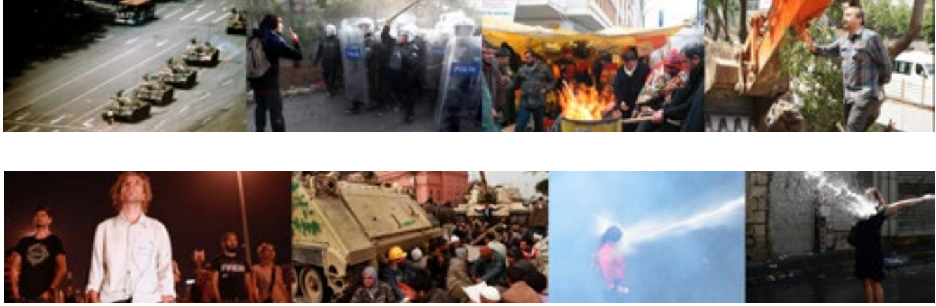
Şekil 2. Kent-Mekansal Makro Stratejiler ve Beden -Mekansal Mikro Direnişler

gelişmesi elbette ki tesadüf değil. Modernite ile birlikte toplumsal olanın öncelikle beden üzerinden inşa edilip kurgulandığı gözönüne alındığında, 19 sisteme dair eleştiri ve başkaldırının da beden üzerinden reaksiyonlarla açığa çıkması da yadırganmamalı.