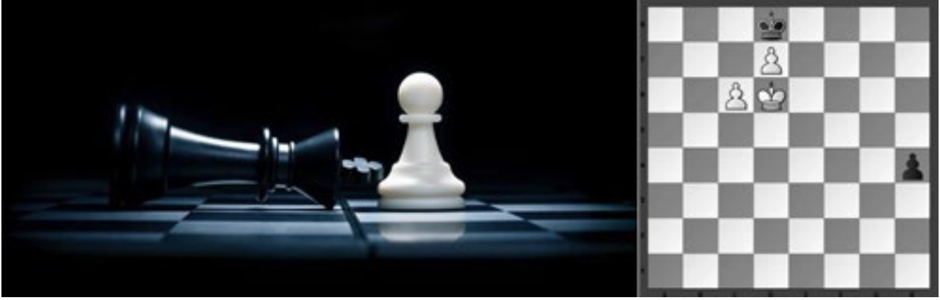
Şekil 3. Satrançta Gücsüz Taşlı Oyun Sonları ve Doğurduğu Sürpriz Sonuçlar

ele geçirilmesi ve (çadırlar ve hafif strüktürler aracılığıyla) fiziksel olarak dönüştürülmesiyle başlayan mücadele, orantısız kuvvet kullanımıyla aynı mekana güvenlik güçlerinin yerleşip, belediye işçileriyle mekanın sembolik olarak yeniden çiçeklendirilmesiyle (ve bürokrasi tarafından yeniden kontrolüyle) sonuçlanmıştır. Ayrıca iktidarı elinde bulunduran erkin bu güçlü direnişe bir başka meydan aracılığıyla cevap vermeye çalışması da bu mücadelenin ne kadar mekansal bir düzlemde seyrettiğinin göstergelerindedir. Gezi Parkı'nın insan bedeni ve hareketleriyle biçimlenen örüntüsel yapısı, her gün artan çadırlarla, mimari malzemelerden bağımsız olarak, sorunsuz biçimde yeniden ve kendiliğinden organize olan kamusal mekandaki bu yeni oluşan dinamikler daha 'esnek ve değişken' bir kent-mekansal olgunun habercisi olmuştur.