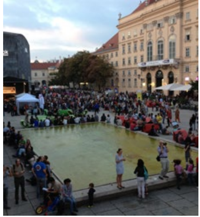
Museumquartier- Viyana