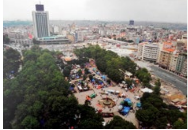
Resim 1. Gezi Parkı'na polis müdahalesinden kısa bir süre önce park içerisinde direniş için toplanmış insanların oluşturdukları yaşam ve toplanma alanları görülüyor. (Fotoğraf; Bünyamin Aygün, Milliyet Gazetesi, Haziran 2013)

Her iki isyanda devlet güçlerince bastırıldı. Her iki isyanda da devletin temel hedefi isyanı bastırmak ve yayılmasını her koşulda engellemek üzerine oldu. Her iki devletin yaklaşımı da başarılı oldu, yani isyanlar bastırıldı ve herşey normale döndü. Ancak hiçbir şey eskisi gibi olmayacaktı. Çünkü Dünya'nın bir çok kentinde, ekonomik olarak kalkınmış ülke kentleri de dahil bu tip marjinalleşmiş, ötekileştirilmiş ve ezilmiş halklar olduğu, topluluklar yaşadığı gün gibi ortadaydı. Ancak bu ezilen ya da haksızlığa uğradığını, baskı altında olduğunu, yaşam alanlarına müdahale edildiğini düşünen toplulukların özellikle genç bireylerinin çok daha bilinçli ve dünyada olan bitenden kendi anne-babalarına göre daha fazla farkında oldukları da bilinen bir gerçek.