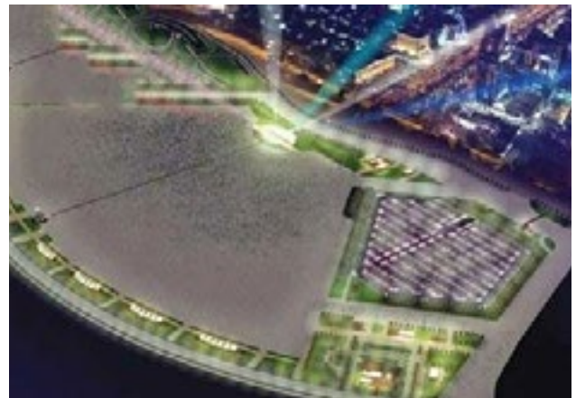
İstanbul Metropolü Miting ve Cösteri Alanı Projesi