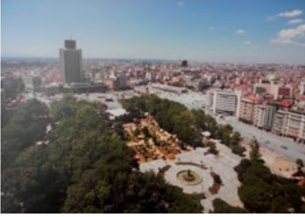
Resim 2. Gezi Parkı'na polis müdahalesinden sonra uzunca bir süre halkın kullanımına kapatılan park alanı görülüyor.

ABD ve Fransa örneklerinde olaylar varoşlarda başlamış, toplumun alt gelir grubu olarak tanımlanan, fiziksel nitelikleri son derece kötü evlerde oturan, marjinalleşmiş grupların içerisinde patlak vermiş ve yayılmıştı. Dolayısıyla bu isyanları "varoş" ayaklanması olarak ifade etmek yanlış olacaktır. Ancak Gezi Parkı ise gerçekten bir kamusal alanda ortaya çıkan ve dalga dalga yayılan dolayısıyla "park" isyanı olarak nitelenebilecek çok farklı karakterde bir olaydır. Bu harekete katılan toplulukların içerisinde birçok gelir grubuna giren, farklı eğitim seviyelerinde, hayata ve çevreye bakışları farklı binlerce insan bulunmaktaydı. Bu farklı toplulukların aynı amaç doğrultusunda bir araya gelişleri ise Gezi olaylarını Los Angeles ve Paris ayaklanmalarından ayıran belki de en temel özelliğidir.