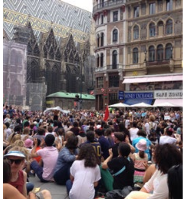
Stephanplatz- Viyana