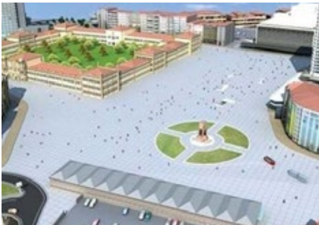
Taksim Meydanı Yayalaştırma Projesi