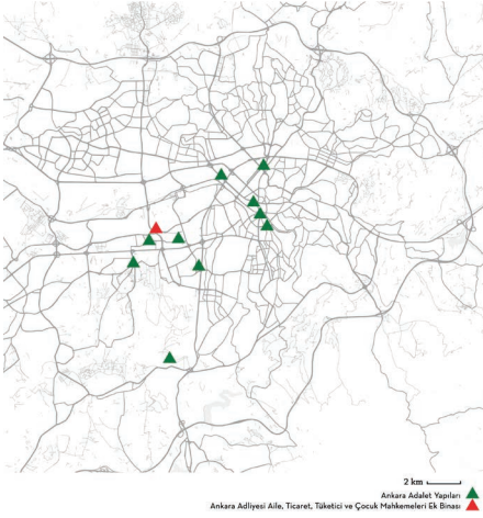
2 km Ankara Adliye Yapıları Ankara Adliyesi Aile, Ticaret, Tüketici ve Çocuk Mahkemeleri Ek Binası