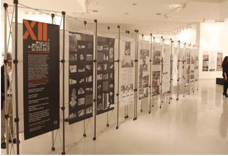
Ulusal Mimarlık Sergisi'nden bir görünüm – Ankara 2010