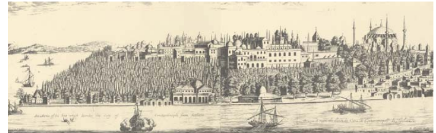
İstanbul Finans Merkezi – Çevre ve Şehircilik Bakanlığı