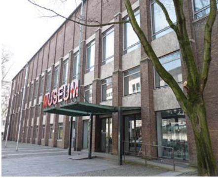
Köln Tatbiki Güzel Sanatlar Müzesi'nden Görünüm 1

Teknik ve Politeknik Araştırma, Geliştirme ve Uygulama Derneği