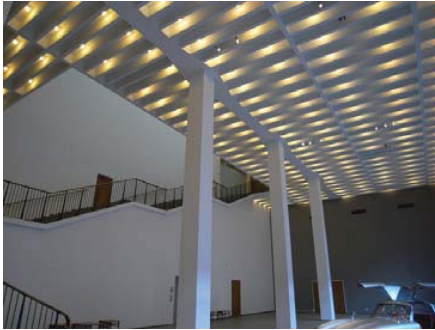
Köln Tatbiki Güzel Sanatlar Müzesi'nden Görünüm 2