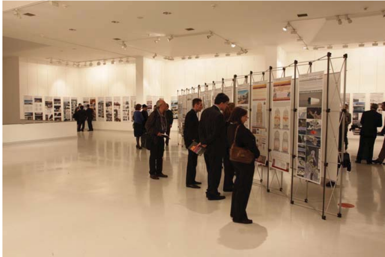
Ulusal Mimarlık Sergisi'nden bir görünüm – Ankara 2010