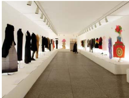
Köln Tatbiki Güzel Sanatlar Müzesi'nden Görünüm 3