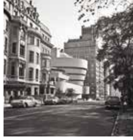
Bir Restorasyon İkonu Olarak Guggenheim Müzesi 36.